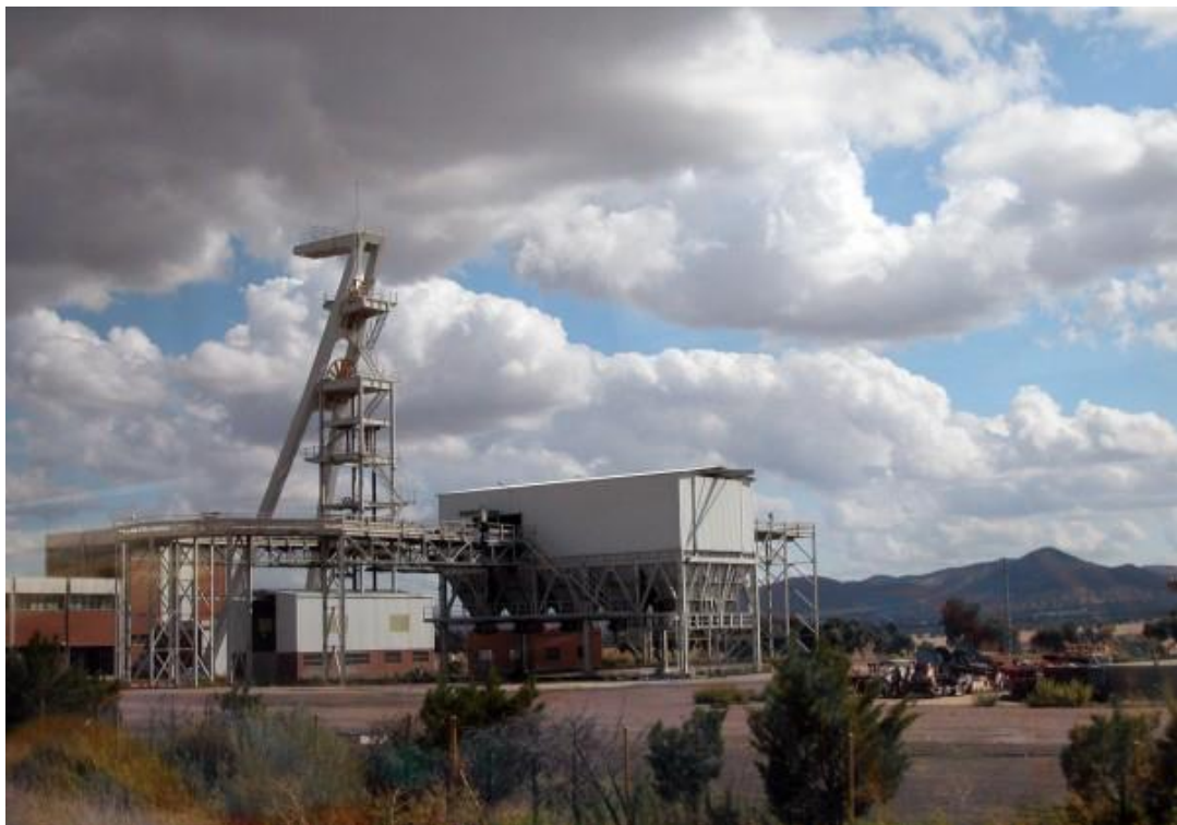
Pozo Retorno. Fuente Obejuna.