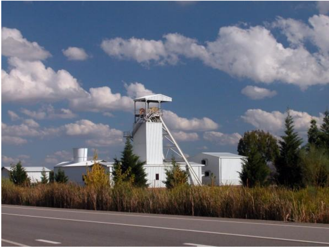
Pozo María, destinado a la extracción de carbón por minería de interior. Fuente Obejuna